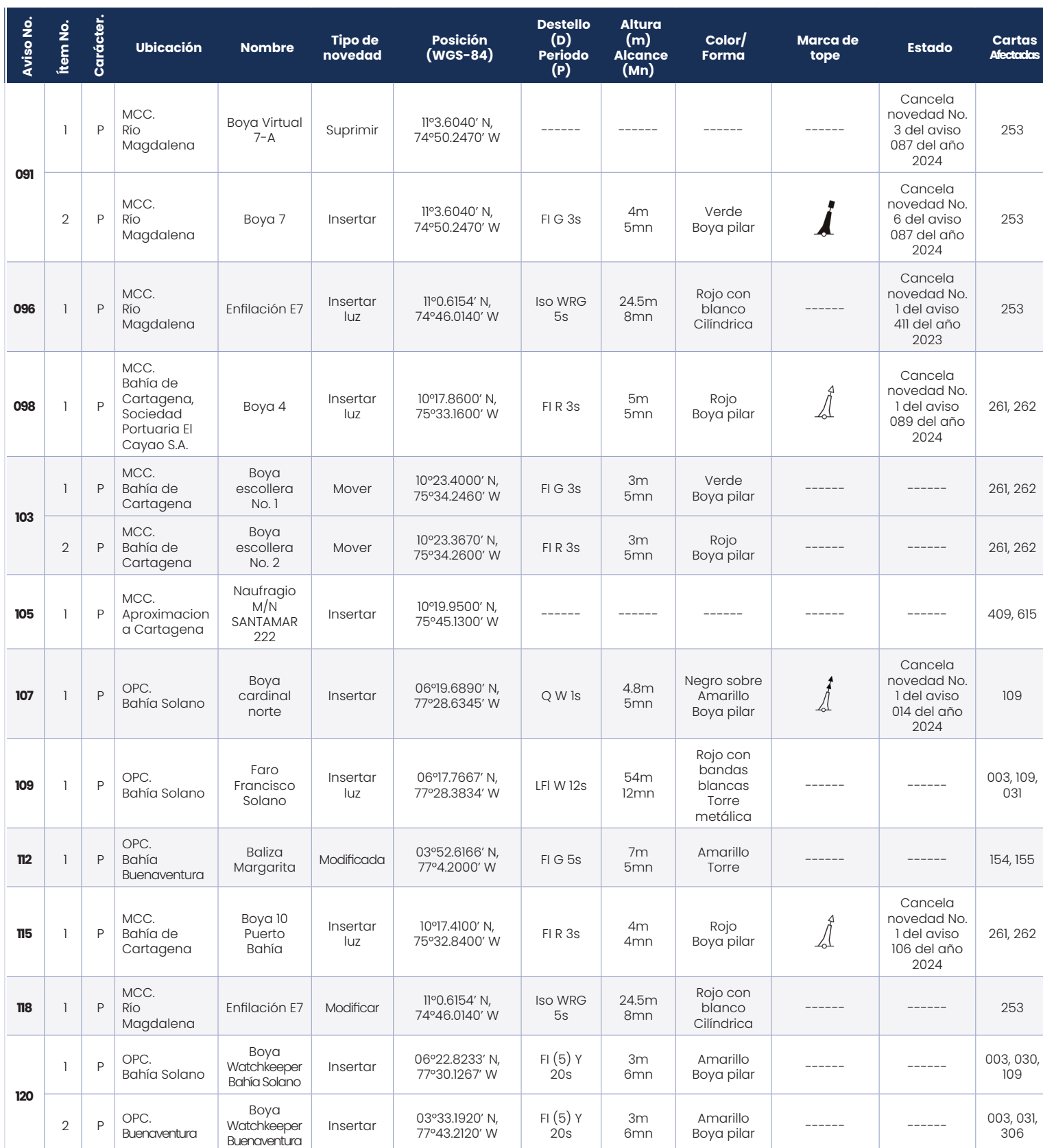
Tabla V. Avisos a los Navegantes permanentes del mes de abril de 2024.