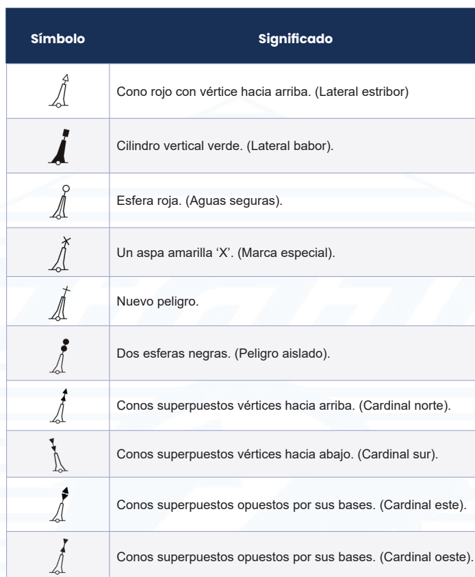
Tabla II. Marcas de tope.