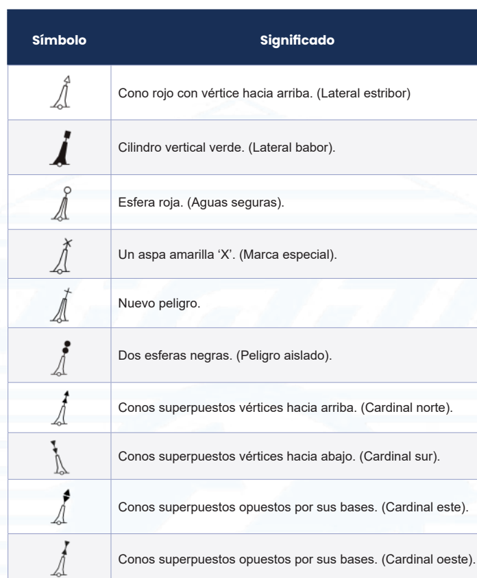
Tabla II. Marcas de tope.