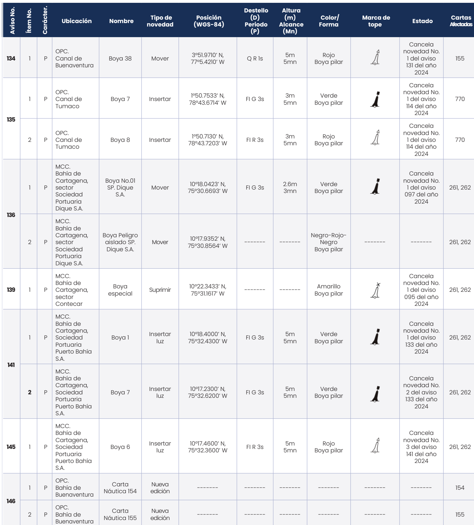
Tabla V. Avisos a los Navegantes permanentes del mes de mayo de 2024.