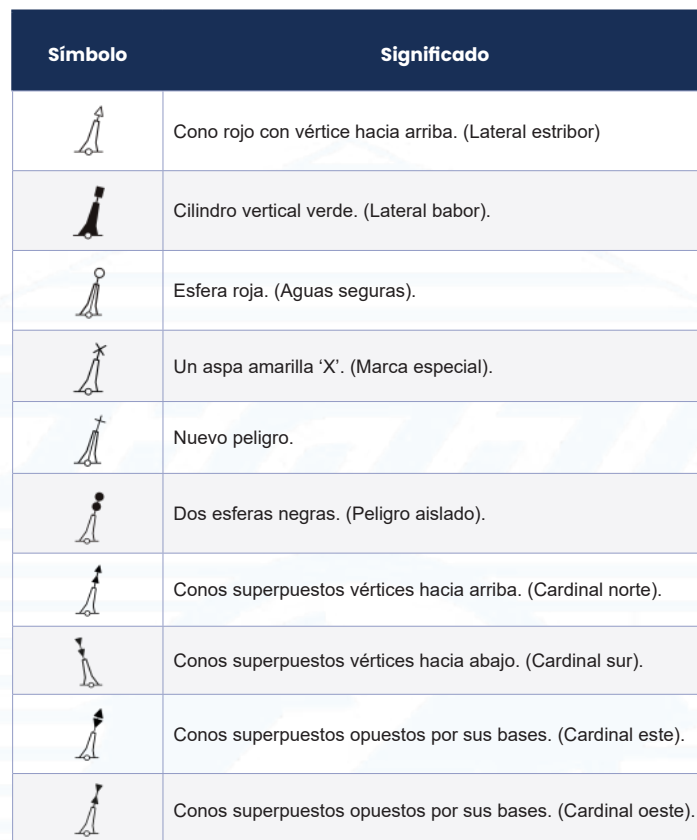
Tabla II. Marcas de tope.