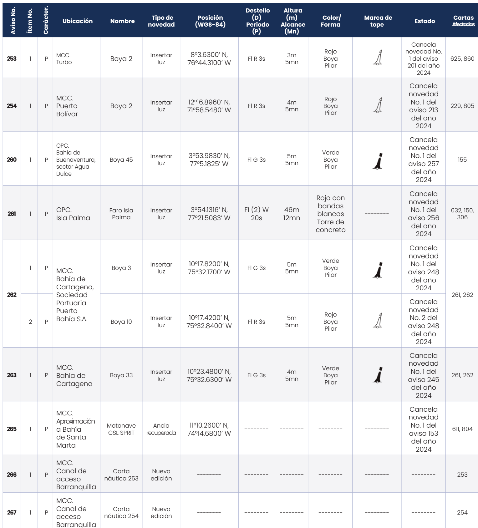
Tabla V. Avisos a los Navegantes permanentes del mes de septiembre de 2024.